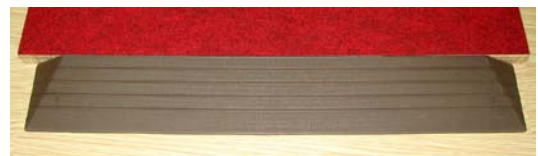
図4 段差解消スロープ

そこで、意匠Bを採用しゴム金型を製作、スロープ専用のゴム配合でスロープを作製した(図4)。なお、スロープ全てをゴムで作製すると重いため、軽量化のために内部は硬質の発泡体を用いた。