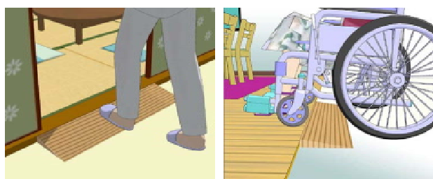
(a) (b) 図1 段差解消スロープ

既存の住環境のバリアフリー化を容易に進めるものとして、段差解消スロープ（以下、スロープ）が多用されている。スロープ上では、歩行機能が低下した高齢者や障害者の移動（図1(a)）、車いす、杖、歩行器、および床走行式リフト等の通過（図1(b)）も考えられ、人と福祉用具との共存が必要である。