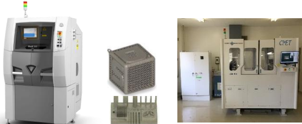
金属3Dプリンタ 砂型3Dプリンタ