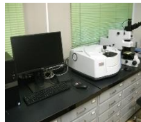
フーリエ変換赤外分光光度計 (赤外顕微鏡付)