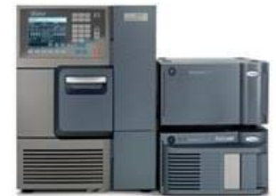
高速液体クロマトグラフ