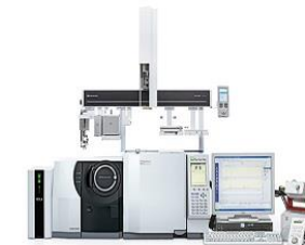
ガスクロマトグラフ質量分析装置