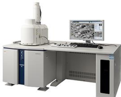
走査型電子顕微鏡 (元素分析機能付)