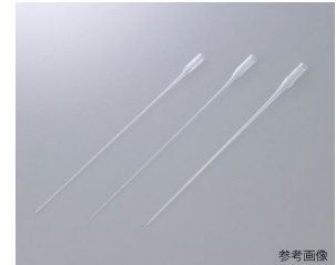
図1: 代表的なガラスキャピラリー - ( 23094 円/25 本 )

分析試料をフィルムで挟み込む、あるいは、ガラスキャピラリー - に充填する場合、フィルムやガラスからもX線の散乱が生じるため、分析試料のX線散乱 ( スペクトル ) を知るには、フィルムやキャピラリー - からの散乱分布を予め測定し、これを除算してスペクトルを評価する必要がある。また、ガラスキャピラリー - は使い捨てであるが一般的に比較的高価なため、たくさんの試料の散乱を測定するには、コスト面で不利である。そこで本研究では、超音波を用いて試料 ( 液体 ) を浮遊・固定し、フィルムやガラス等からの余計な散乱を生じない試料の固定を方法の実現可能性について検討を行った。