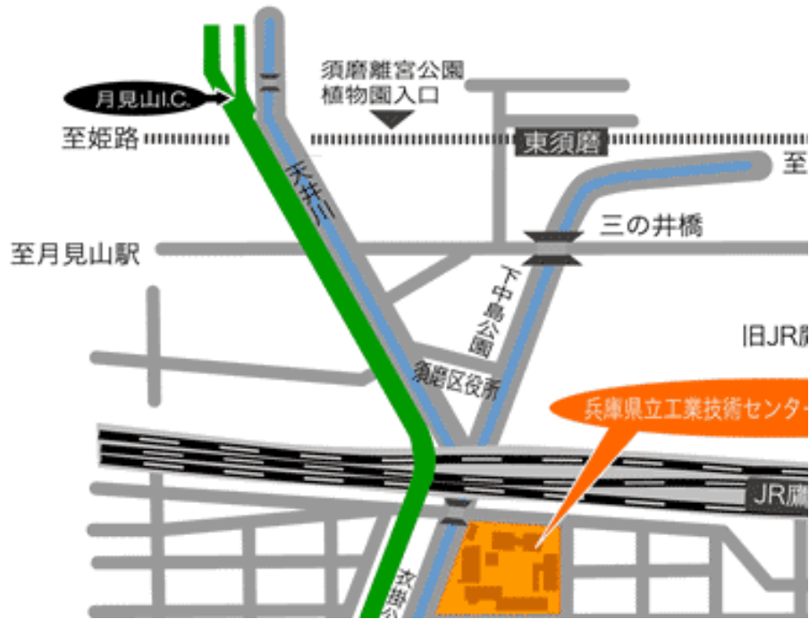
兵庫県立工業技術センター内案内図